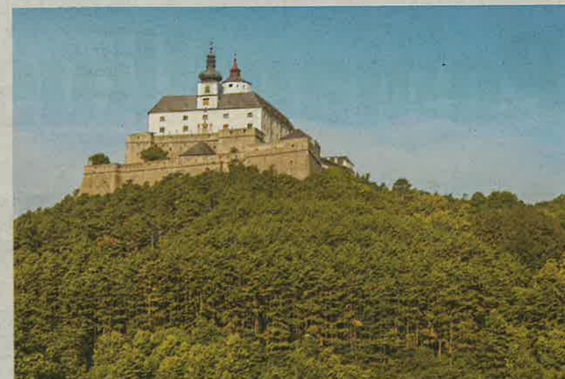
A végvárvidéken egykoron valóságos várlánc állott, Fraknó ennek része volt

A Fertő tó Közép-Európa harmadik legnagyobb állóvíze. A legendák és érdekességek között olvashatjuk, hogy a Fertő tó akkor keletkezett, amikor két szivtelen legény megtárgadta egy szomjas öreg vándor kérését. Inkább kiöntötték kulacsukból a vizet a földre, minthogy vizet adtak volna neki inni. A következő éjszaka elborította az ár az egész vidéket, így keletkezett a Fertő tó. Joseph Haydn története 1809-es halála után is bővelkedett izgalomban. Az eredetileg Bécsben eltemetett zeneszerző koponyáját ugyanis ellopták, hogy tanulmányozhassák rajta a zsenialitását. A lopás csak az 1820-as újratemetéskor derült ki,