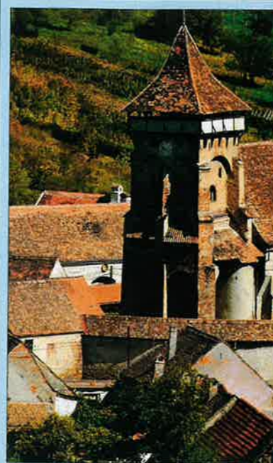
Nagybaromlak – erődtemplom

Pataki János úgy volt vele, hogy útnak indult, elgyönyörködött a székelyföldi falvak, hegyek, mondák szépségén, s úgy gondolta: amit látott, érzett, azt másnak is el kell mondania – szavakkal is, képekkel is. Jól gondolta. Igen szép könyv született 2005-ben: Székelyföld – A legendák világa címmel. A jó fogadtatás, a váratlan, de megérdemelt siker felbátorította a szerzőt; egy év múlva megszületett a Szászföld – A várak világa . Ezt az albumot mutatjuk most be néhány képpel, ám megjelent mellette Pataki János erdélyi utazási tapasztalatainak egyáltalán nem mellékes summázata is, Székelyföld ízei címmel – az együtt élő népek hagyományait őrző gazdag erdélyi konyháról. A magyar látogatók közül csak kevesen, a nyugatiak, főleg németek, amerikaiak többségében egyenesen Szászföldre indulnak, ahol égbe törő hegyek között épen maradt középkori városokat, masszív erődtemplomokat, romantikus várakat találnak. Köztük Törcsvárat, Vlad Tepes várát, a hozzá tartozó Drakula-kultusszal, s amely várat a hírek szerint most készül eladni régi-új Habsburg tulajdonosa. –il-