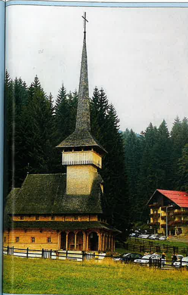
Síkőzpont a Keresztény-havasokban (Brassó-Pojána)